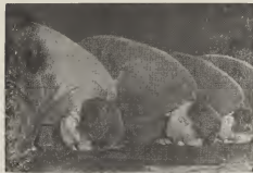
El presidente de Egipto, Gamal Abdel Nasser (a segundo desde banda derecha) ta aparecé riba e grafica aki cu su gabinete durante un ceremonia mensualan na Cairo.